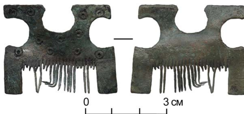
Рис. 1. Медный гребень с городища Искер (ТИАМЗ, № ТМ-24737/35)

Уточнить культурную и хронологическую принадлежность интересующей нас находки позволяют опубликованные аналоги,