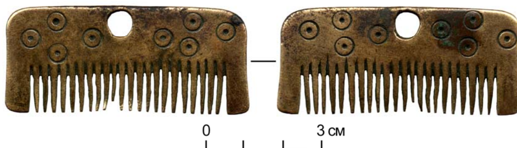
Рис. 2. Медный гребень из Каргалинской волости (ТИАМЗ, № ТМ-8449)

Исходя из многократно звучащего в научной литературе тезиса о сакральной и ритуальной функции гребня в традиционной культуре рассмотрим семантику, зашифрованную в форме и орнаментации предмета.