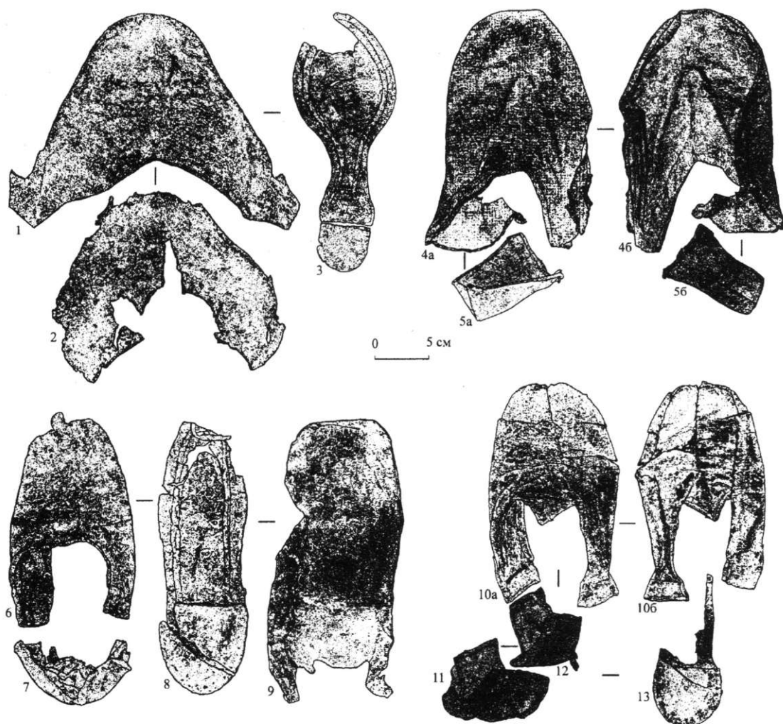
Рис. 1. Обувь жестких форм подтипов 1–2 (1–5 – подтип 1; 6–13 – подтип 2): 1 – головка; 2 – поднаряд; 4, 6, 10 – головки с поднарядом; 3, 8, 9, 13 – подошвы; 5, 7, 11, 12 – задники (1–13 – кожа)

достоверно реконструируется на основании одного относительно целого экземпляра (отсутствует голенище) (рис. 1, 6–9) и некоторых других находок. Головка двухслойная, имеет овальную форму носа и удлиненные крылья (рис. 1, 6). Поднаряд головки из более тонкой кожи состоит из двух частей, которые скреплены друг с другом переметочным швом. Задник составной, сшит из двух кожаных деталей, между которыми находится берестяная вставка, придающая конструкции дополнительную жесткость (рис. 1, 7). Внутренний слой задника несколько длиннее внешнего, вероятно, для соединения с крыльями головки «в наклад», что улучшало влагонепроницаемость обуви.