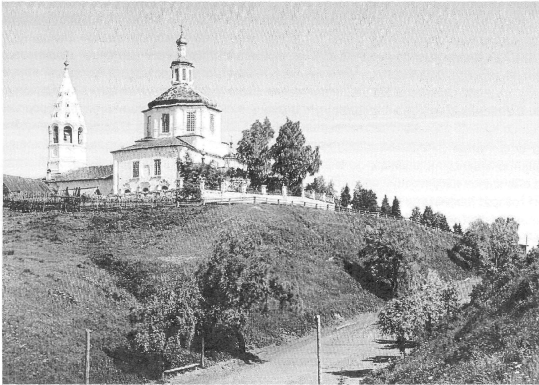
Рис. 1. Вид на Никольскую церковь и взвоз в 1912 г.

В результате археологических исследований на Чукманском мысу Тобольска стало возможным ввести в научный оборот одно из ранних приходских кладбищ города, определить его место в структуре посадской застройки XVII–XVIII вв.