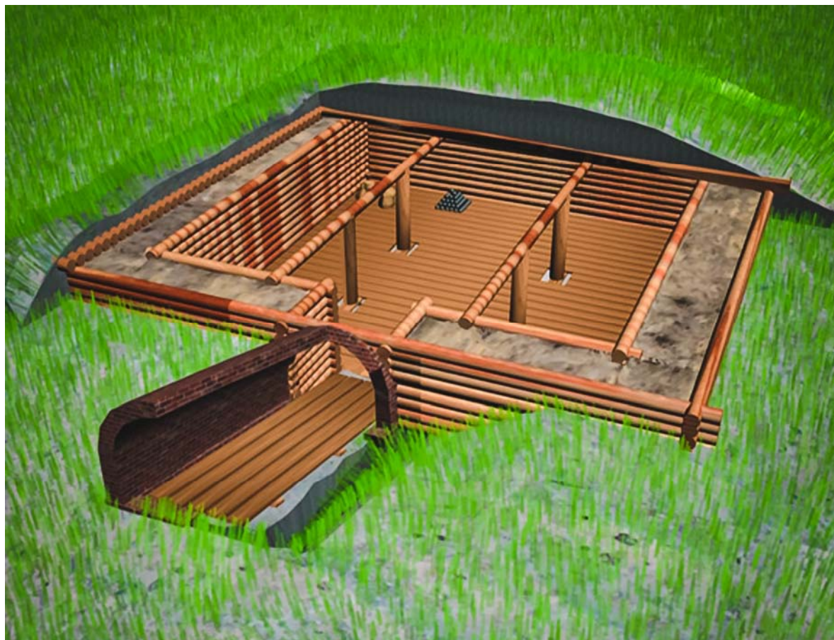
Рис. 2. Графическая реконструкция порохового погреба

янском остроге был выполнен в виде деревянной лестницы [Там же. С. 277] В дальнейшем конструкция погребов в Тобольске мало менялась. В качестве близкого аналога можно рассматривать чертеж порохового погреба на плане города Тобольска 1748 г. 1 Снаружи этот погреб выглядел как земляной холм, с выходом и продухами, сложенными из кирпича. Сам погреб был деревянным, заглубленным в землю. Размеры его, согласно чертежу, 8,6 \times 10,8 м, высота от пола до перекрытия 4,2 м, высота от пола до потолка 2,16 м (сажень). Последнее значение взято нами за предполагаемую высоту погреба XVII в. и соответствует 11–12 рядам деревянного сруба.