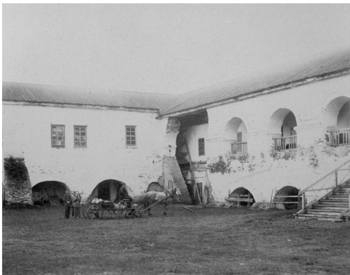
Рис. 3. Гостиный двор (конец XIX- начало XX вв.).